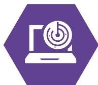
Técnicas y herramientas de atacantes reales