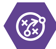
Recomendación de mejores prácticas